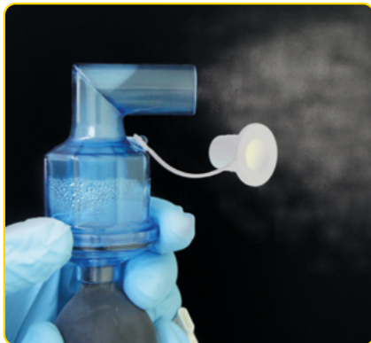
Je zou een fijne nevel moeten zien