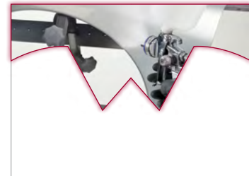
Zichtsveld van vergelijkbare maskers